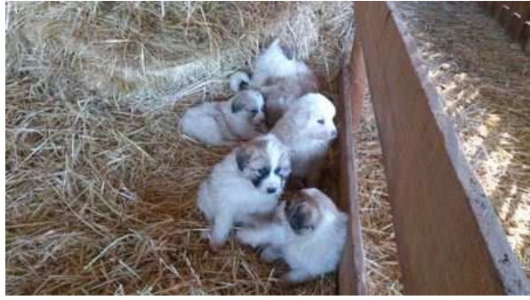
Cadellada G de Cal Manistró

Gerri de Cal Manistró a José Manuel Soler d'Alcorisa (Teruel)