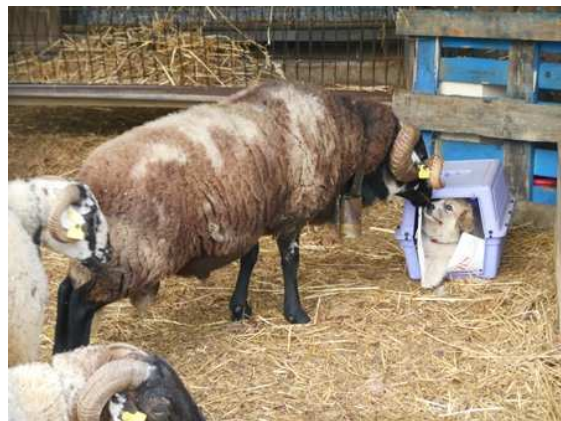
Glére de Cal Manistró