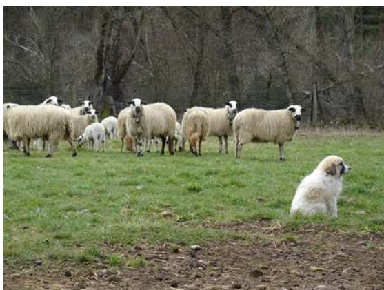
Gaula de Cal Manistró