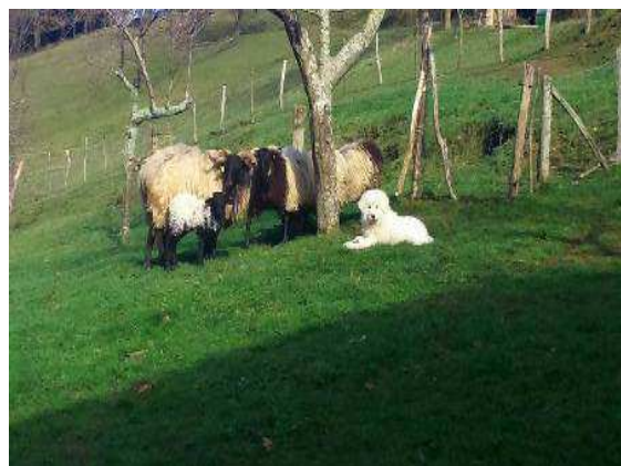
Gola de Cal Manistró